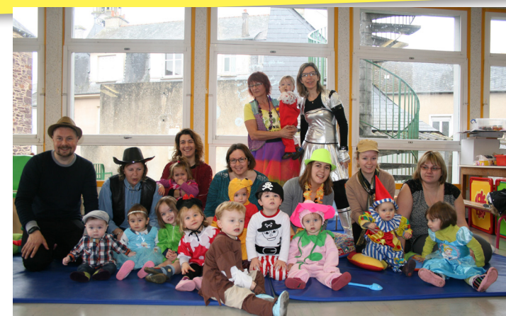
Déguisements en Espace-jeux, antenne de Saint-Méen

Pas besoin d'attendre carnaval ou halloween pour se déguiser, une malle à déguisement peut être proposée aux enfants tout au long de l'année !