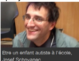
Etre un enfant autiste à l'école, Josef Schovanec

« J'ai passé 3 jours de « ouf » comme diraient mes ados. Pour exemple, je n'ai pas encore osé dire à mes enfants, que j'ai chanté à me casser la voix et dansé sur des airs bretons entre 3 drapeaux dans le métro marseillais ! Je me suis amusée comme une adolescente, j'ai appris comme une adulte, et j'ai compris comme une personne âgée. La conférence sur l'autisme m'a bouleversée. Certains disent que les autistes sont dépourvus d'émotion, il va falloir qu'on m'explique comment Josef Schovanec a fait pour transmettre autant d'émotions (rire, tristesse, joie et colère) dans cette salle d'une bonne centaine de personnes captivées ! Je ne connaissais pas l'autisme, maintenant je veux en savoir plus... »