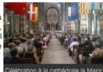
Célébration à la cathédrale la Major

J'ai échangé avec des personnes d'horizons divers et je me suis régalée de ces rencontres. Je n'avais jamais participé à une messe avec un millier de personnes, cette ferveur dans cette basilique magnifique, c'était juste inoubliable. Le soleil marseillais nous a accompagné lors de notre ballade sur le vieux port. Je sors de ce congrès étourdie mais néanmoins enchantée. Merci l'Apel ! »